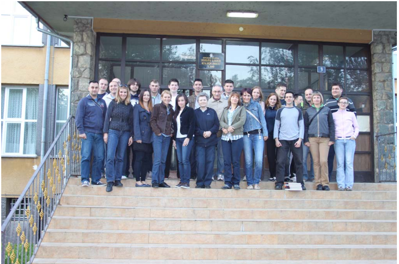
ZAJEDNIČKA FOTOGRAFIJA PRIJE POLASKA NA PUT