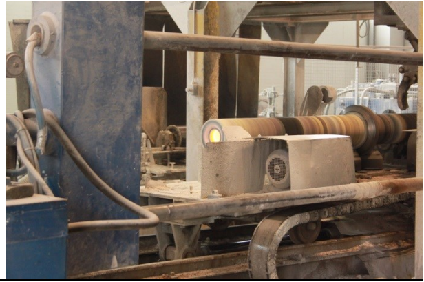
Ferro-preis d.o.o., Čakovec