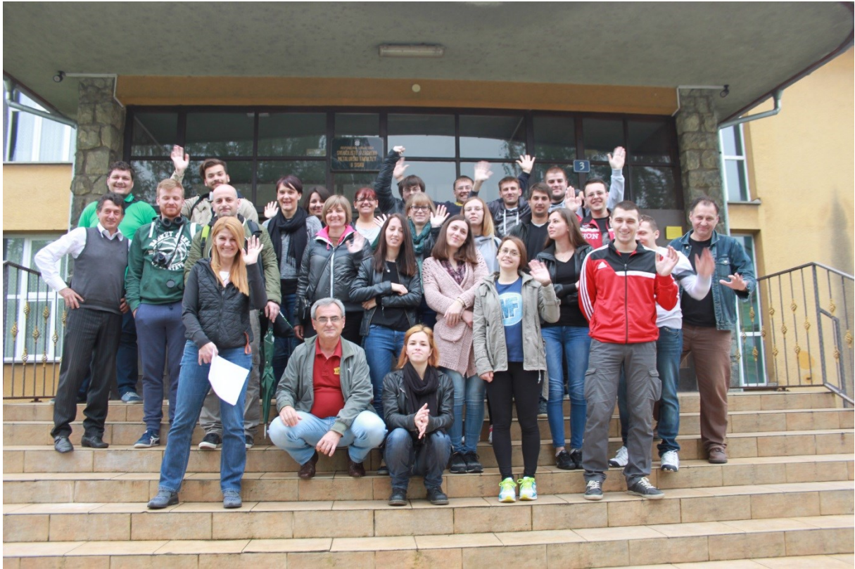
Polazak, Metalurški fakultet, 11.5.2016., 7:00