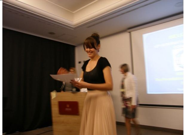
Dodjela priznanja sponzorima