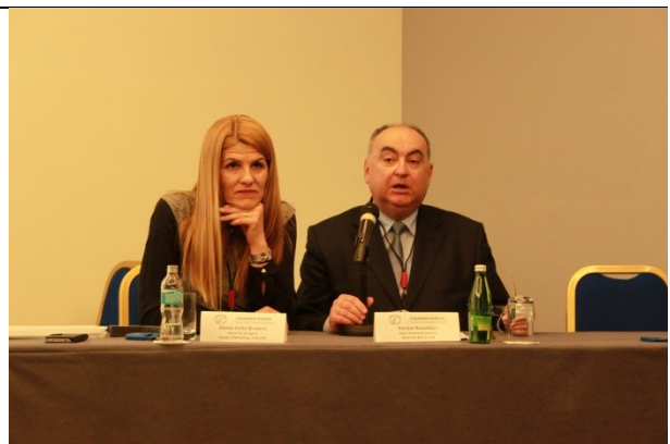
Kongresna dvorana, predavanja