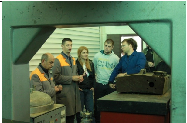
Alas-info d.o.o., Donji Vukojevac