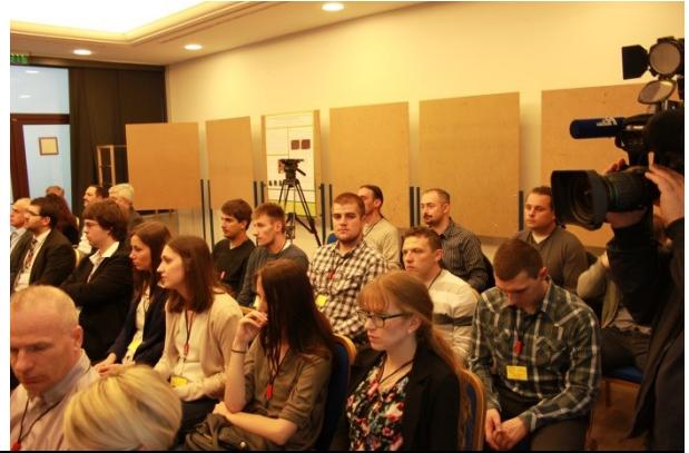
Kongresna dvorana, predavanja