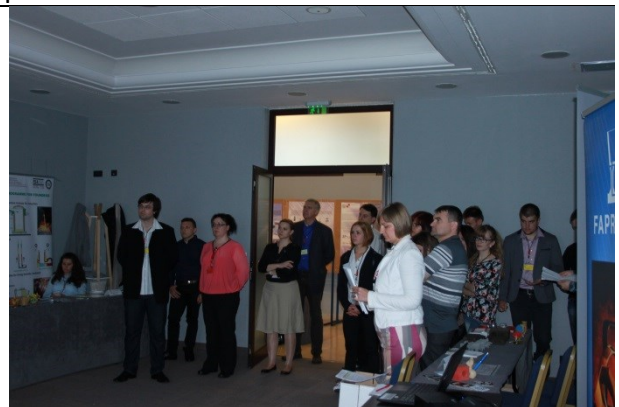
Studentska poster sekcija