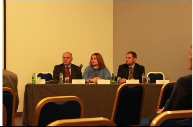
Svečano otvaranje 15. Međunarodnog savjetovanja ljevača