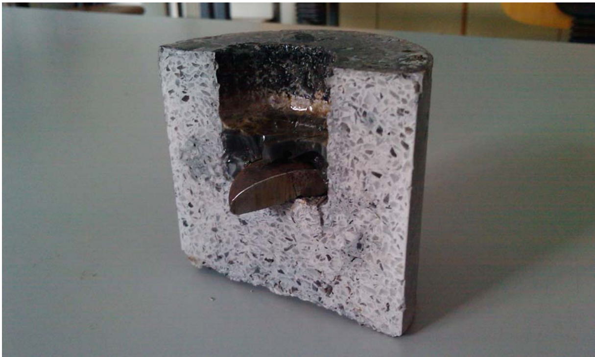
Slika 1: Ispitivanje čeličnog uzorka na kolegiju Procesna jeklarska tehnika

Kao najveći problem bi se mogao navesti jezik, koji nije tako teško za savladati iako na početku predstavlja problem. Mogli bi naglasiti da je problem tu u prvom redu zbog toga što postoji mnogo naglasaka slovenskog pa nije jednostavno „pohvatati“ što svaka osoba govori. Velika barijera je bila i kod pisanih materijala (skripta i slično), iako su nam dopuštali da sve seminare i vježbe pišemo na hrvatskom. Odlično je to što profesori manje-više svi znaju hrvatski i uvijek bi nam ponovili dijelove predavanja koje nismo razumjeli. Što se tiče toga imali smo stvarno veliku podršku profesora. Također smo za svaki kolegij mogli ići na konzultacije koliko god smo puta željeli da razjasnimo nejasnoće u vezi predavanja. Uglavnom pred kraj boravka ta jezična barijera je „pala“ pa nam više nije bio problem komunikacija s profesorima čime nam je bilo i lakše savladati gradivo potrebno za polaganje kolegija.